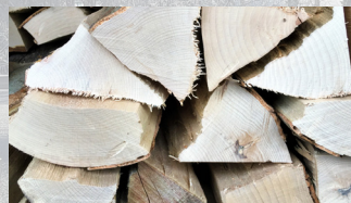
Brennholz Holzart: Buche* / Esche* Herkunft: Schweiz 400 kg ab CHF 149.00

Mir freud üs scho uf's noii Jahr mit eu und uf wiiteri schöni Momänt!