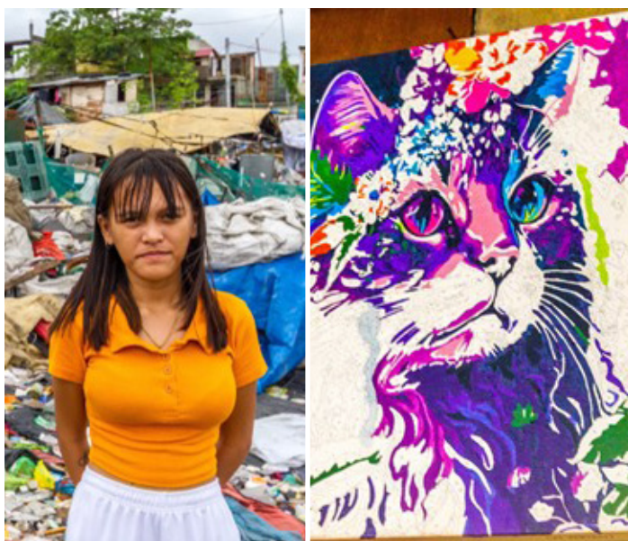
© Internationale Entwicklung /Hoffnung auf der Müllhalde

Die Heilsarmee Schweiz hat 15 000 Franken Soforthilfe für die Opfer des verheerenden Hurrikans Melissa in der Karibik bereitgestellt. Der Sturm der Kategorie 5 hatte Ende Oktober grosse Teile der Region verwüstet, besonders Jamaika schwer getroffen und auch in Haiti grosse Zerstörungen angerichtet. Zahlreiche Menschen verloren ihre Häuser und ihr gesamtes Hab und Gut, viele wurden verletzt oder mussten in Notunterkünften untergebracht werden. Mit ihrer finanziellen Unterstützung ermöglichte die Heilsarmee eine rasche Nothilfe vor Ort. Dank ihrer lokalen Strukturen und Partnerorganisationen konnte die Hilfe schnell und unbürokratisch dorthin gelangen, wo die Not am grössten war.