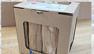
Brennholz im Trage- karton , Länge 25 cm Holzart: Buche* / Esche* Herkunft: Schweiz 10kg CHF 8.50