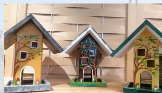
Vogelhäuser handbemalt Stück ab CHF 88.00