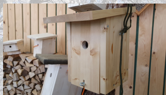
Nistkästen , div. Grössen Holzart: Fichte* / Tanne* Herkunft: Schweiz / Österreich Stück ab CHF 28.00