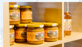
Bienenhonig 250 g CHF 8.00 500 g CHF 15.00