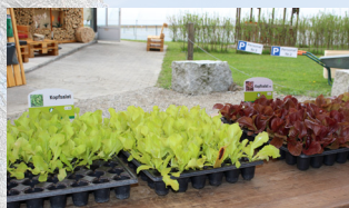
Salat- und Gemüse- setzlinge im Frühling Stück ab CHF 0.50