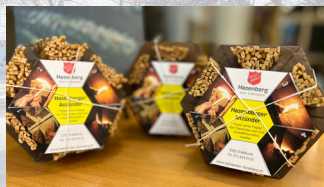
Hasenberger Anzünders Holzart: Fichte* Herkunft: Schweiz Stück CHF 2.90