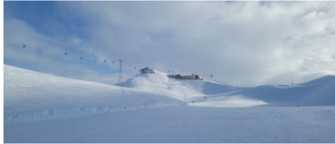
Ski-Ausflug nach Davos Klosters

Es tut sich was im Hasenberg – auch, was das Freizeitangebot betrifft: Dank einem in den vergangenen Jahren stetigen Ausbau des Personals im Wohnen haben wir in diesem Bereich Ressourcen wie noch nie. Diese möchten wir maximal und effizient für die Begleitung unserer Bewohner einsetzen. Dabei haben die individuelle Bezugspersonenarbeit und der Gesamtprozess der Klientenentwicklung erste Priorität. Zweite Priorität sind Freizeitaktivitäten, welche dem Bedarf und den Fähigkeiten der Bewohner entsprechend realisiert werden können. Die Erfahrungen aus durchgeführten Aktivitäten möchten wir nutzen und optimieren und dabei die individuellen Talente und Fähigkeiten abholen und gemeinsam erleben. Damit es uns gelingt, die Freizeitaktivitäten gut zu verwirklichen, wurde ein zusätzlicher Dienst eingeführt, welcher die Durchführung von Freizeitangeboten am Nachmittag oder am Abend ermöglichen soll.