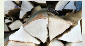
Brennholz Holzart: Buche / Esche Herkunft: Schweiz 400 kg ab CHF 149.00

*Die wissenschaftlichen Namen der Holzarten können unter www.holzdeklaration.ch abgefragt werden.