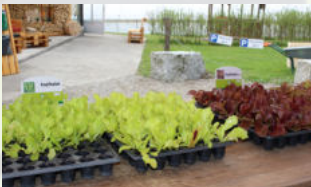
Salatsetzlinge Stück CHF 0.50