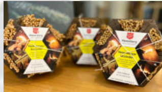
Hasenberger Anzünder Holzart: Fichte Herkunft: Schweiz Stück CHF 2.90