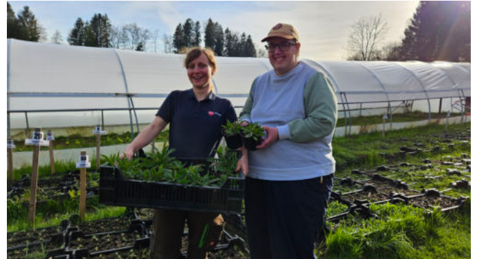
Wildblumen-Produktion auf dem Hasenberger Feld