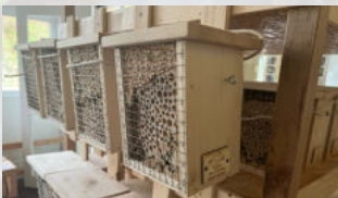
Insektenhotel Holzart: Fichte / Tanne Herkunft: Schweiz Stück ab CHF 16.00