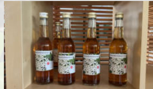
Holundersirup nach Hausrezept 350ml CHF 6.50