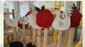
Holzdeko für Garten Holzart: Fichte Herkunft: Schweiz Stück ab CHF 12.00