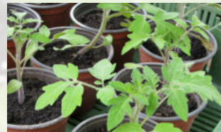
Tomatensetzlinge Stück ab CHF 2.50