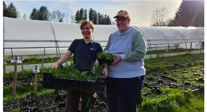
Wildblumen-Produktion auf dem Hasenberger Feld