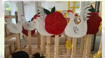
Holzdeko für Garten Holzart: Fichte Herkunft: Schweiz Stück ab CHF 12.00