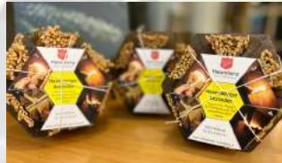
Hasenberger Anzünder Holzart: Fichte Herkunft: Schweiz Stück CHF 2.90