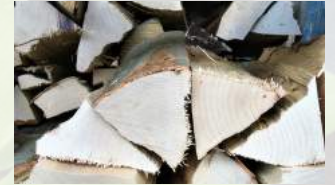
Brennholz Holzart: Buche / Esche Herkunft: Schweiz 400 kg ab CHF 149.00

*Die wissenschaftlichen Namen der Holzarten können unter www.holzdeklaration.ch abgefragt werden.