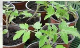
Tomatensetzlinge Stück ab CHF 2.50