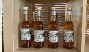
Holundersirup nach Hausrezept 350ml CHF 6.50