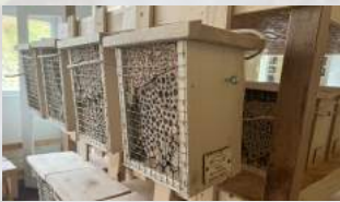
Insektenhotel Holzart: Fichte / Tanne Herkunft: Schweiz Stück ab CHF 16.00