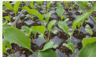
Gemüsesetzlinge Stück CHF 0.50