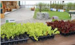
Salatsetzlinge Stück CHF 0.50