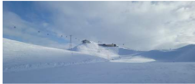
Ski-Ausflug nach Davos Klosters

In den letzten Monaten wurde anhand von schriftlichen und mündlichen Bewohner-Umfragen eine Aktivitäten-Börse erstellt mit Angeboten, welche im Haus, in der nahen Umgebung, aber auch weiter entfernt durchgeführt werden können. Ideen, wie Kochen und Backen, Geschichten lesen, ein Spaziergang am Hasenberger Weiher, ein Waldfondue, Kerzenziehen, gemeinsame Spiele, ein Kino-, Museums- oder Zoobesuch, Mini-golf, eine Schiffsfahrt, ein Veloausflug, Schlitteln, Skifahren oder Schlittschuhlaufen, fanden so den Weg in die Börse. Diese Ideensammlung wächst stetig. Es ist uns wichtig, dass im Angebot jeder Bewohner etwas finden kann, was seinen Fähigkei-